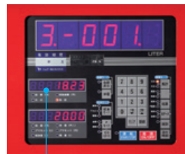
〈時刻表示 18時23分〉〈年月日表示 21年5月19日〉