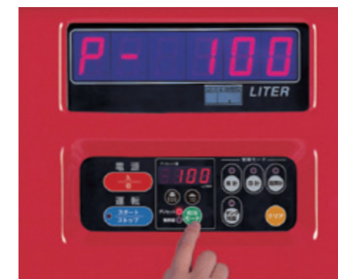
大型ローリー プリセット付パネル

〈標準装備〉 日計・集計機能で給油量を自動的に記録。プリンター(オプション)に接続すれば集計結果の出力も可能です。