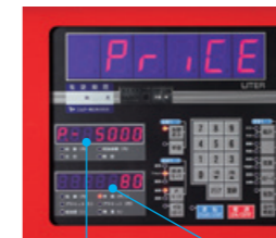
〈プリセット金額5,000円〉〈単価80円〉