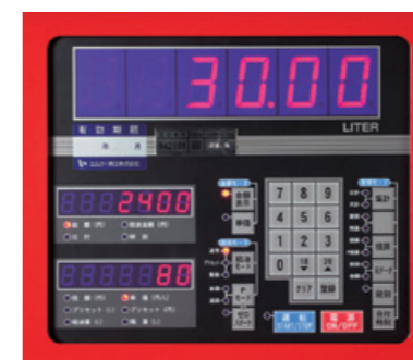
金額プリセット給油

※プリセット金額が10L以上の場合に給油できます。 ※軽油取引税に対応できます。