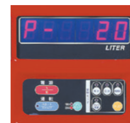
ミニローリー プリセット付パネル