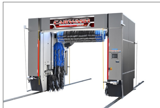
インパクトレッド