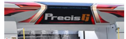
高輝度LEDディスプレイ

洗車機に表情を生み出す目のアイコンや指のアイコンを使ったカウントダウンなど、表現力豊かな動画を表示します。待機中の車に向けた洗車メニュー案内や店舗サービス紹介などが可能です。また、洗車工程を目盛りで表示することで、待ち時間のストレスを軽減します。