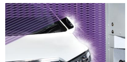
車形スキャンイメージ

535本×3列同時発光方式の広角型センサーを用いた、独自のセンシング技術を採用。水しぶきや湯気の影響をおさえ、装備品の装着位置までピンポイントで捉えます。読み取った精密な車形データをもとにブラシやブローを制御し、車の細部まで丁寧に洗い上げます。