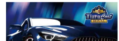
「ティアラコートロイヤル」イメージ

ガラス系成分の高濃度3Dレジンを、ガラス系ならではの透明感と艶のある硬質な被膜を形成。防汚性、耐候性に優れており、汚れや紫外線から車のボディを守ります。