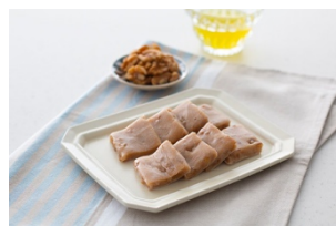
くろみもち(長野県)