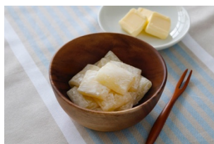
バターもち(秋田県)