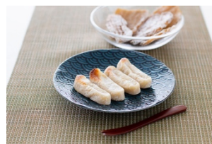
かんころもち(長崎県)