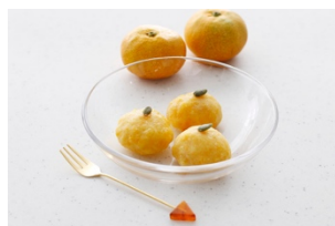
みかんもち(愛媛県)