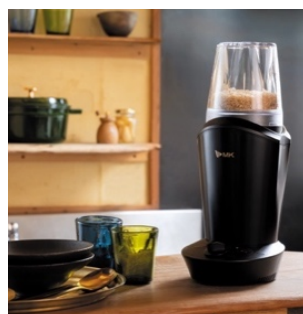
アーバンブラック