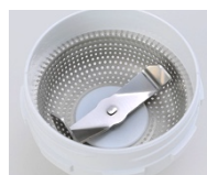
凹凸のない精米バスケット