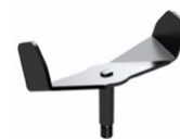
特殊形状の精米羽根