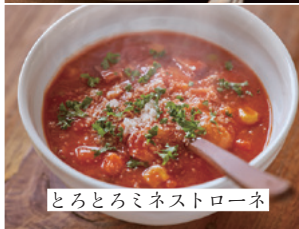
とろとろミネストローネ