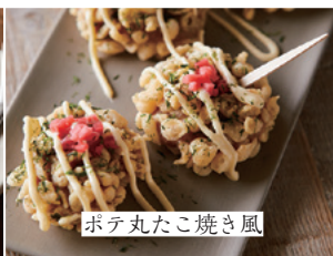
ポテ丸たこ焼き風