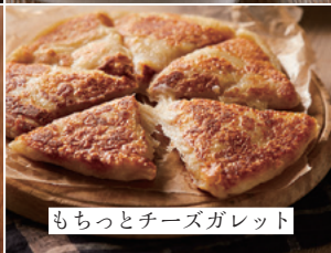
もちっとチーズガレット