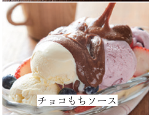
チョコもちソース