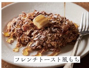
フレンチトースト風もち