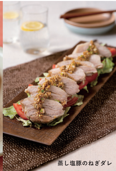
蒸し塩豚のねぎダレ