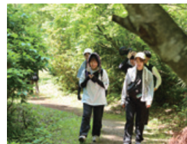
ヘルスツーリズムの一環で行った 新入社員トレッキング

今後も社員の健康保持・増進を図る健康経営を最重要課題の一つととらえ、代表取締役社長を最高責任者として、担当役員と推進部門が中心となり、全ての役員と社員が健康経営に取り組んでまいります。