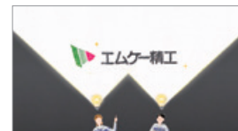
全編アニメーションで 制作された会社案内動画

会社案内の動画を刷新しました。新しい動画では当社理念であるMKフィロソフィーを強く発信した内容となっており、会社概要だけでなく、どんな姿勢でモノづくりをしているのか、また、どんなことを考えている人間が集まった会社なのかを表現しています。採用活動の他、これから取引をしようとお検討くださるお客様や、メディアで見て興味を持ってくださった一般のお客様まで広くご覧いただける内容となっています。