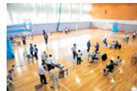
健康経営の一環として 実施した歩行ケア

今後も社員の健康保持・増進を図る健康経営を最重要課題の一つと捉え、代表取締役社長を最高責任者として、担当役員と推進部門が中心となり、全ての役員と社員が健康経営に取り組んでいきます。