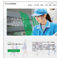
リニューアルされた コーポレートサイト

コーポレートサイトのリニューアルを行いました。当社のイメージカラーである緑色を基調に、清潔感のあるサイトになっています。また、これまで未対応であったスマートフォンにも対応し、使いやすいサイトにしました。