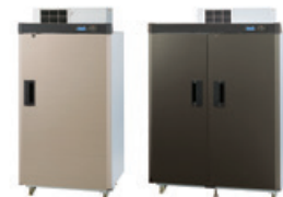
農家向け低温貯蔵庫

この結果、ライフ&サポート事業の売上高は、68億4千7百万円（前期比16.1%増）となりました。